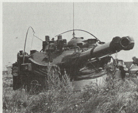
Jagdpanzer «Kürassier» mit 10,5-cm-Kanone (Pfeilmunition) in halbverdeckter Stellung.

Die derzeitigen und die für einen überschaubaren Zeitraum zu erwartenden Kräfteverhältnisse des österreichischen Bundesheeres verlangen einen