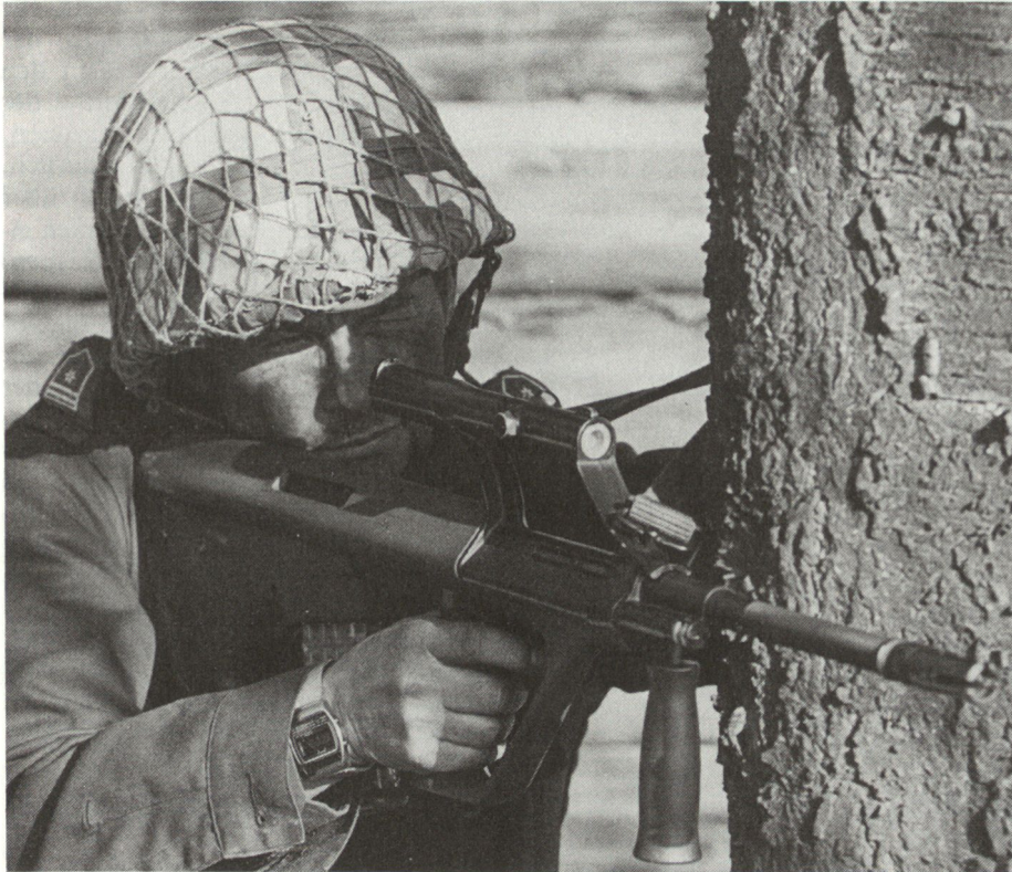
Das Sturmgewehr verfügt über eine mit der Waffe fest verbundene optische Zielvorrichtung.

Verfahren gesetzt. Die Theorien wurden im Hinblick auf ihre praktische Anwendbarkeit ausgetestet und erforderlichenfalls modifiziert. Die Entwicklung ist nunmehr so weit fortgeschritten, dass die Anlernphase durch eine Festigungsphase abgelöst werden kann.