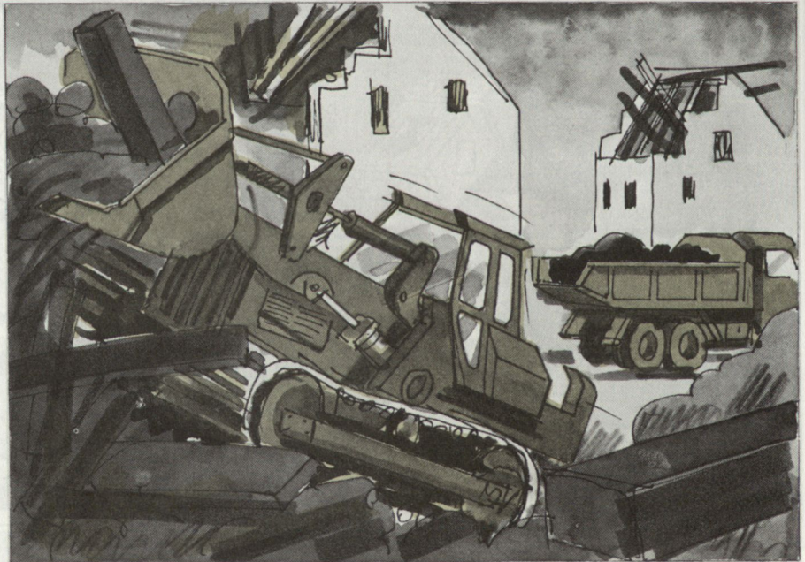
Räumung von Strassenzügen.