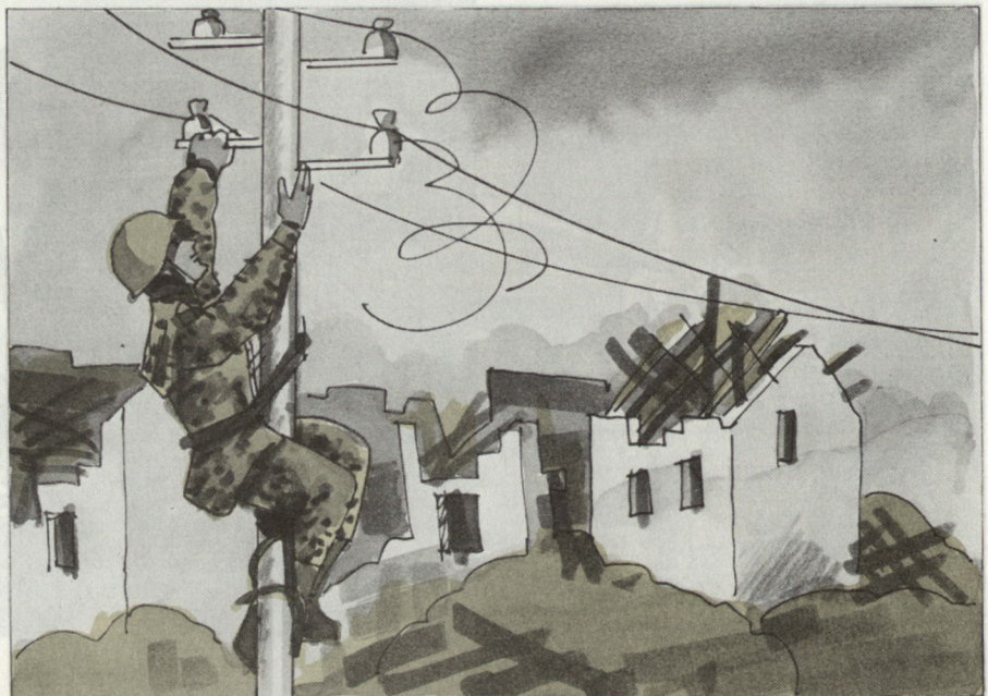
Behebung von Schäden an der Infrastruktur.