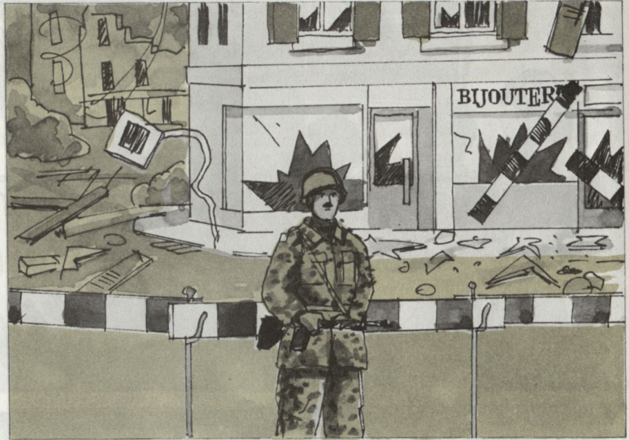
Absperren des Schadengebietes und Verhinderung von Plünderungen.