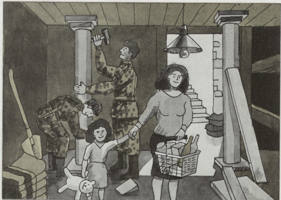
Ausbau von Schutzräumen.