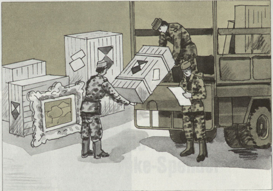
In schweren und ausgedehnten Schadenlagen (Nachangriffsphase)