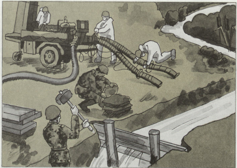
Erstellen von künstlichen Wasser- bezugsorten.