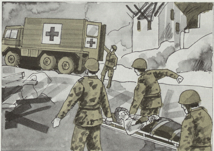
Versorgung und Abtransport von Verletzten.