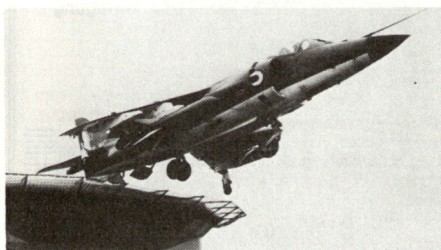
Bild 1. Start des Sea Harrier.