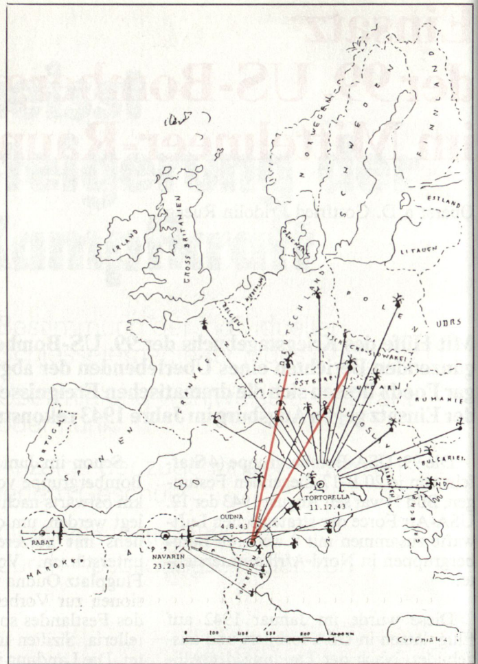
Bild 3. Bombereinsätze der 99. US-Bomber-Gruppe im Mittelmeer-Raum.

Im Dezember 1943 befanden sich die Alliierten bereits in Neapel im Vormarsch auf Rom und verfügten über