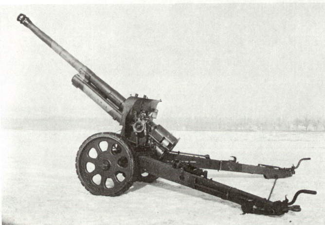
Die 10,5 cm Schwere Kanone in ihrer ursprünglichen Ausführung mit Vollgummireifen.

Die Schwere Motorkanonenabteilung bestand 1939 aus einem Abteilungsstab mit 76 Of/Uof/Sdt, geführt durch den Abteilungsadjutanten, und 2 Geschützabteilungen mit 4 Geschützen mit