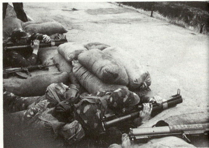
Fachdienstoffiziersschüler beim Schiessen mit der Wegwerfpanzerfaust.