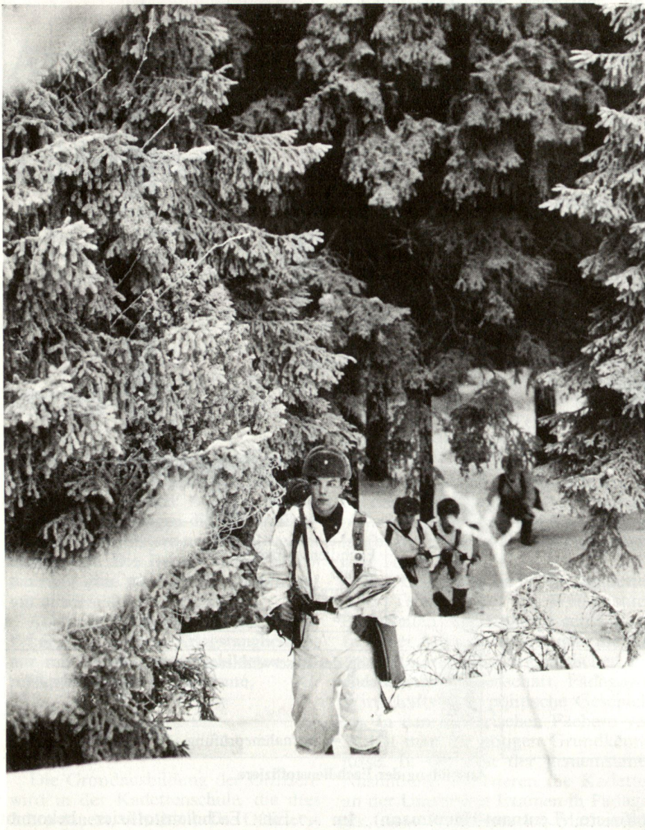
Panzerkadetten während der Gefechtsübung.

schaft und einen Teil der Gruppenführerausbildung erhalten hat. Er ist also gewohnt, Mitglied einer solchen Gemeinschaft zu sein, zu deren Führer er ausgebildet wird.