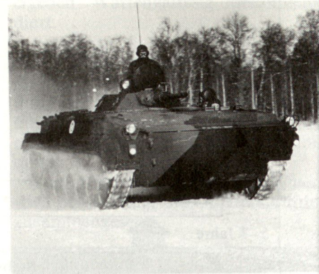
Schützenpanzer BMP-1 mit 73-mm-Kanone.

In den Truppenverbänden der verschiedenen Waffengattungen haben die Offiziersanwärter die Möglichkeit, die Führungsfunktionen zu praktizieren. Die Offiziersanwärter werden als Zugführer und Ausbilder in der Grund- und Sonderausbildung eingesetzt. Sie bereiten die Übungen und Unter-