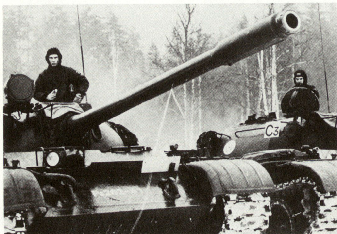
Panzerkadetten während der Gefechtsübung.

Die Grundausbildung des Fachdienstoffiziers findet in der Fachdienstoffizierschule statt. Lehrgang I führt zur niedrigeren Amtsprüfung und