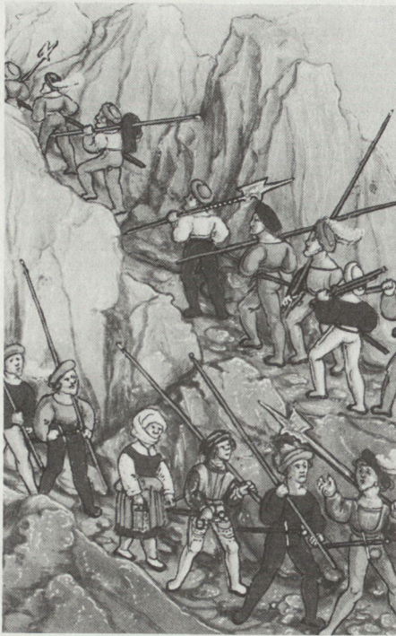
Schweizer Söldner in französischem Dienst am Gotthard. Diebold Schilling, Luzerner Chronik.