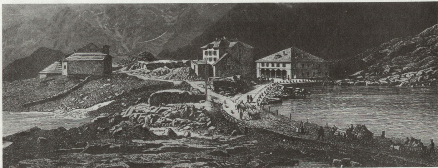
Gotthardpasshöhe zirka 1850. Rechts die alte Sust.

Das ausländische Interesse blieb wach. So verwendete die Grossmacht Spanien den Gotthard zu Beginn des 17. Jahrhunderts als sicherere Verbin-