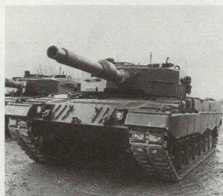
Der Leopard II: Zukunftsvision, die für die Mech Div 11 in den Jahren 1992/93 Realität werden soll.