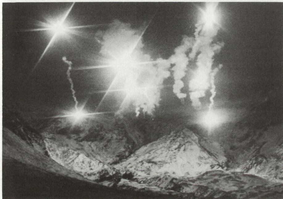
Der Schulung des Nachtgefechtes wird in der Mech Div 11 grosse Bedeutung zugemessen. Die Erfahrungen münden in der Erkenntnis, dass eine Ausrichtung auf einfache, klar strukturierte Übungsabläufe nottut.

1961 mit der Truppenordnung 61 aus der Taufe gehoben, feiern die mechanisierten Divisionen in der Schweiz heuer