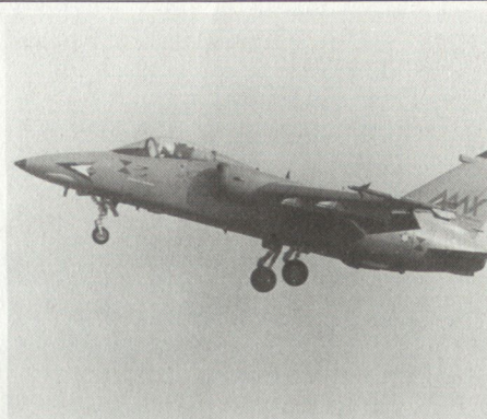
Prototyp Aermacchi/Embraer AMX.

Probleme bekam Bell Textron nach Kürzung des Beschaffungsvorhabens von 578 OH-58D auf vorerst 90 durch die US Army im Etatjahr 1987. Nach technischen Problemen bei Beginn wurde man sich über Flugvorführungen der AN-124 Condor nicht einig. Über dem deutsch-französischen Panzerabwehrhubschrauber-Programm (PAH-2/HAC/HAP) schwebt der Pleitegeier. Um Zeit bis nach der Bundestagswahl im Januar 1987 zu gewinnen, verschob man überfällige Entscheidungen erneut. Die Industrie neigt dazu, das Projekt abzuschreiben, auch wenn noch an («Torschlusspanik») Alternativen gearbeitet wird. Zu gross sind Schwierigkeiten und unterschiedliche Auffassungen bei-