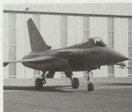
AMD/BA Dassault-Breguet Rafale.

der Partner, militärisch und industriell. Politisch ist dergleichen allein nicht lösbar. Wenn sich zwei zanken, freut sich der Dritte: Agusta rechnet sich vermehrt Chancen für die A-129 Mangusta aus.