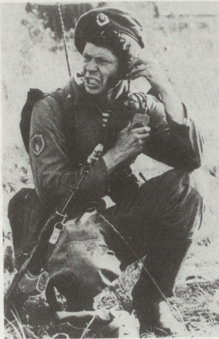
Sowjetischer Funker bei den Lla-Truppen

Aus der Arbeit der Funker eines Kommandostabsfahrzeugs (KSF). Die Besatzung eines KSF besteht aus drei Mann, nämlich dem Kommandanten (einem Wachtmei-