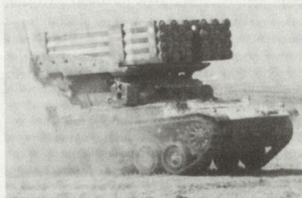
Israelische Version auf AMX-13-Fahrgestell

Die US-Army plant für die neunziger Jahre eine neue PAL-Familie, die als Ersatz der in grosser Zahl vorhandenen TOW-Lenk Waffen vorgesehen ist. Die Entwicklungsarbeiten an der neuen AAWS-H (Advanced Antitank Weapon System-Heavy) sollen im nächsten Jahr beginnen, vorgesehen ist die Fabrikation von drei verschiedenen Systemvarianten. Die TOW steht heute in mehr als 30 Armeen im Einsatz. Als neueste und wahrscheinlich letzte Version steht gegenwärtig die Version 28 – eine Weiterentwicklung der auch von der Schweiz beschafften TOW 2 – in Entwicklung. H. G.