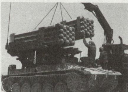
Aufmunitionieren am Versorgungspunkt