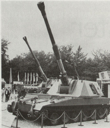
Die neuentwickelte Panzerhaubitze AS90 mit einem modernen niederen Chassis.

Die britische Firma Vickers entwickelte das System GBT155, einen Artilleriemodulturm, der auf verschiedenen Fahrgestellen (z.B. Centurion, M-60, T-Panzer) gesetzt werden kann. Als einzige Neukonstruktion mit diesem GBT155-Turm ist die aus einer Gemeinschaftskonstruktion britischer Firmen entstandene AS90 zu erwähnen. Ein