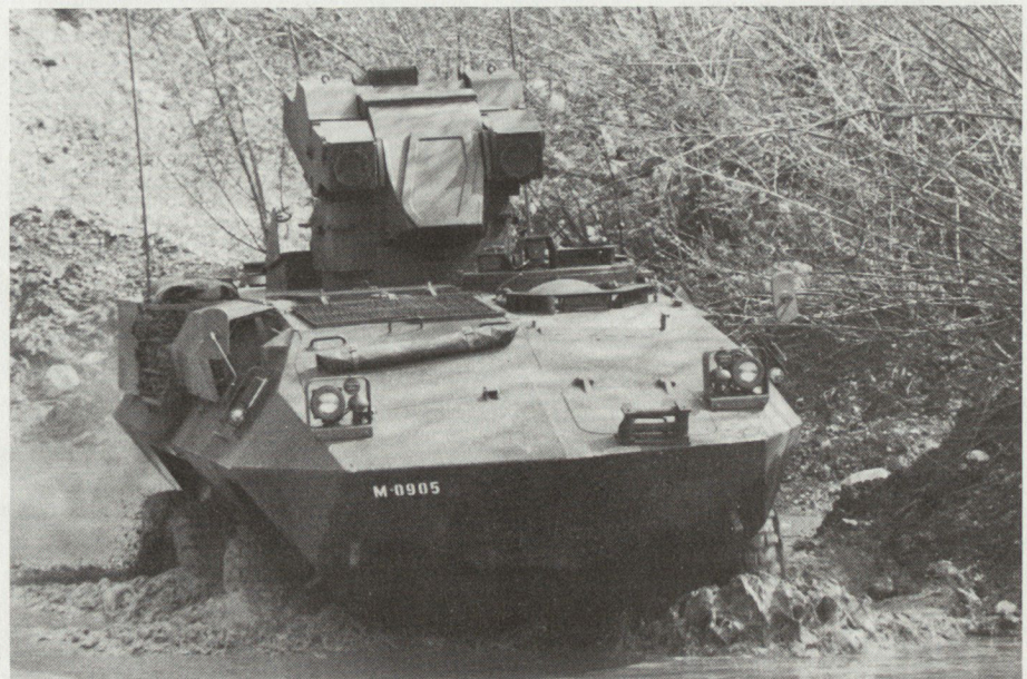
Seit 1983 waren Teile der Pzaw Kp 28 bei allen Truppenversuchen mit dem Panzerjäger dabei.