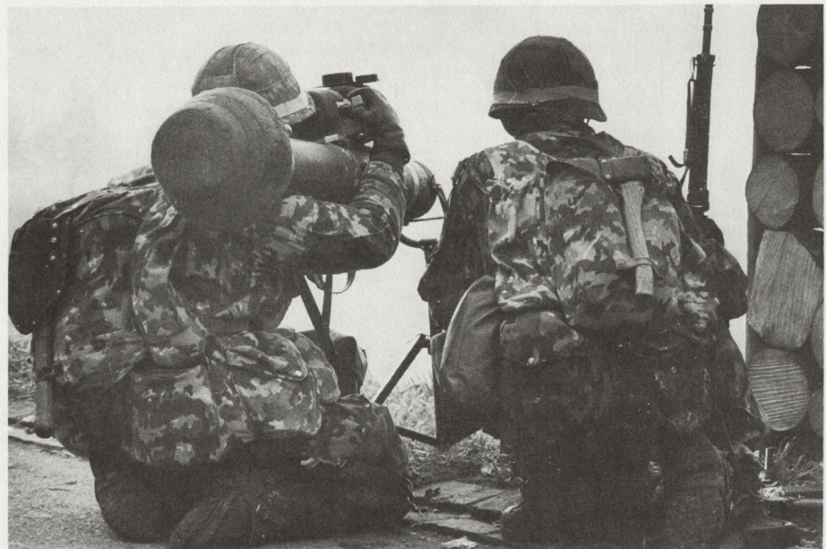
Auch die Infanterie ist heute beweglich und panzerabwehrstark. Dragoneinsatz während der Übung Dreizack im November 1986. Hier in der ungewohnten Rolle der angreifenden Partei.