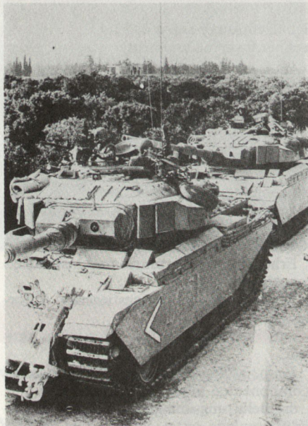
Leistungsgesteigerte CENTURION mit Blazer-Zusatzpanzerung

mäss dieser Übersicht beträgt der Anteil der alten, noch nicht leistungsgesteigerten Panzer in diesen Ländern zwischen 30 und 60% des Gesamtbestandes.