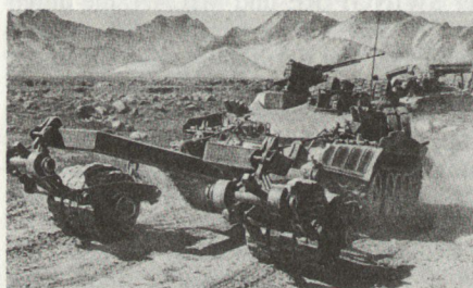
Einsatz von Minenräumwalzen an Spezialpanzer.

Pioniere als erste landen und den Landeplatz nach Minen absuchen zu lassen. Das Minensuchen erfolgt in erster Linie visuell. Verdächtige Stellen werden mit Minensuchgeräten abgesucht. Das visuelle Minensuchen hat sich bewährt, da vermutete Stellen gewöhnlich an äusseren Merkmalen erkennbar sind: Gestörte Bodenoberfläche, verwelkendes Gebüsch, Glitzern eines Drahtes, Reste von Verpackungsmaterial oder Papierfetzen. Ausserdem werden Minensperren von den Mujaheddin in der Regel markiert, durch eine Steinpyramide oder zwei aufeinandergelegte Steine.