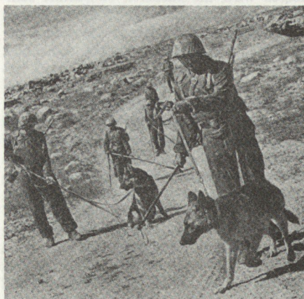
Aufspüren von Minen mit Minensuchhunden.

Bei taktischen Luftlandungen mit Helikoptern ist es zweckmässig, die zugeteilten