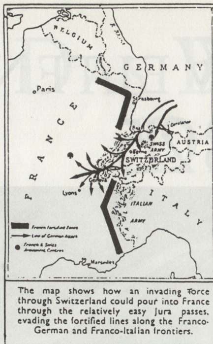
(Karte aus der «Sunday Times» 1933.)

«Some Swiss soldiers think they have good grounds for believing that, when Germany is ready for war, her offensive on the West will not pass through Belgium or Luxemburg, but will go through Northern and Western Switzerland, in the directions of Geneva, as the highway to Lyons and to the French arsenals