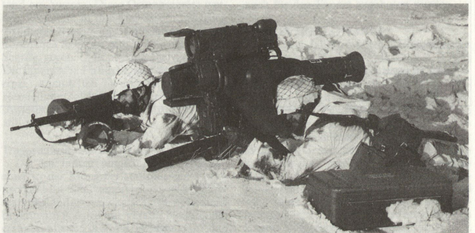
PAL MILAN mit aufgesetztem MIRA-Gerät

Mit diesem Wärmebildzusatz zum normalen Visier wird diese Waffe auch nachts ohne pyrotechnische Gefechtsfeldbeleuchtung einsetzbar. Ein Erkennen von Fahrzeugen soll bei normalen Verhältnissen bis über 2000 m eine Identifizierung bis etwa