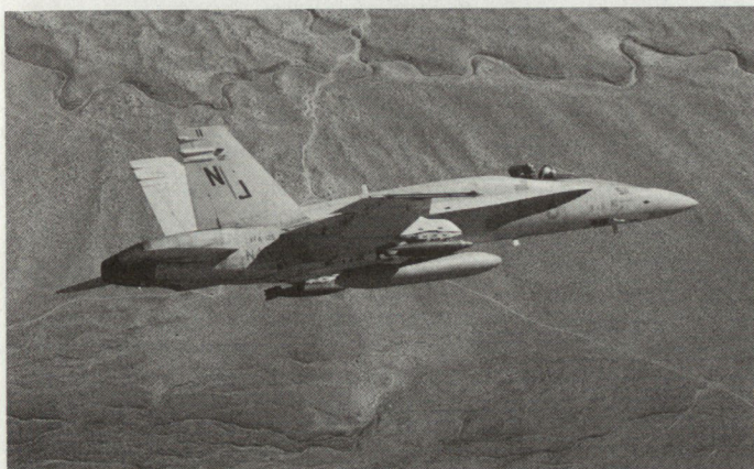
F-18 mit Bombenlast und Zusatztanks. Im Rahmen des kanadischen North American Defense Beitrages (NORAD) sind F-18-Einheiten auf den Canadian Force Basen Cold Lake Alberta und Baggotville stationiert, während eine weitere Einheit sich auf der CF Base von Baden-Soellingen BRD befindet.