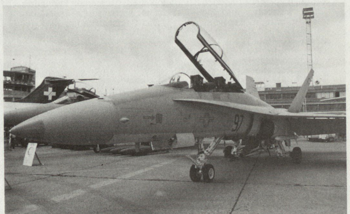
Zweisitzige F-18-Version am «Salon aéronautique de Paris» 1983.