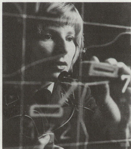
Viele der 16 000 Angehörigen der Flugplatzbrigade 32 sind Frauen. In den Einsatzzentralen sind sie in den vielfältigsten Funktionen tätig.

mengefasst, die sich nicht direkt mit dem Flugzeug befassen: Flugsicherung, Munitionstransport, Unfallpikett, Werkbetrieb, Übermittlung, Sanität und Motorwagendienst. Für die Bereitstellung der Flugzeuge ist die Fliegerkompanie zuständig. Sie sorgt für die Wartung, für die Munitionierung, das Auftanken und die zahlreichen Kontrollen im und am Flugzeug. Mit den Reparaturen befasst sich die Flugzeugreparaturkompanie. Hier finden sich die Triebwerk-, Funk-, Geräte- und Waffenmechaniker. Sie führen auch periodische Kontrollen an den Flugzeugen durch. Aufgabe der Fliegergeniekompanie ist es, Kriegsschäden an Pisten und Rollwegen zu beheben sowie Geländeverstärkungen auf dem Flugplatz zu erstellen und auszubauen. Diese Einheit verfügt sowohl über Baufachleute wie auch über die notwendigen Baumaschinen und -geräte.