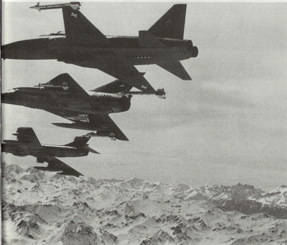
Welcher Flugzeugtyp auch immer: Die Flugplatzbrigade 32 stellt auf jedem Flugplatz den Einsatz der Kampf- und Leichtflugzeuge sicher. Das ist ihr Auftrag.