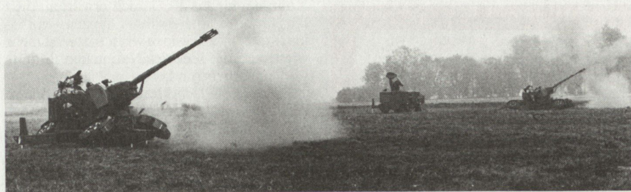
Eine M Flab-Feuereinheit bei der Schussabgabe

Art und Umfang der erschwerten Bedingungen dürfen nicht dem Zufall überlassen werden oder gar das Ergebnis mangelhafter Vorbereitung sein. Nur erschwerte Bedingungen, die von