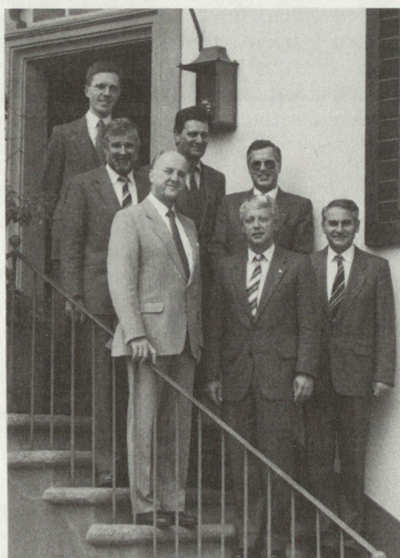
Der SOG-Präsident, umrahmt von der SOSM und dem Redaktor der ASMZ.

Mein Wunsch ist, dass nächstes Jahr die 10. Skimeisterschaften in Brig wie-