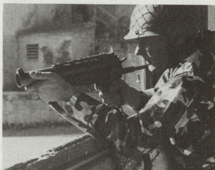
40-mm-Granatpistole HK69A1 von Heckler und Koch.

Die erste, in den USA stattgefunden Entwicklung eines als Schulterwaffe einsetzbaren Granatgewehres geht auf die im Koreakrieg durch amerikanische Truppen gesammelten Erfahrungen zurück. Bereits in den 60er Jahren erfolgte darauf im US-Heer die Einführung des 40-mm-Granatgewehres M-79 und einige Jahre darauf die