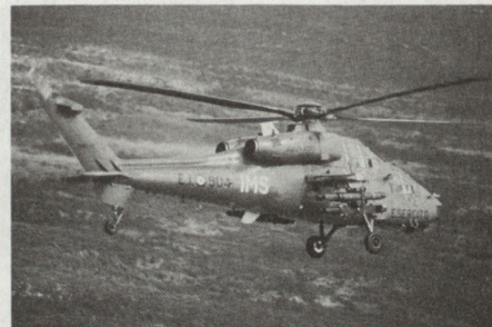
A-129 MANGUSTA während eines Testfluges, bisher sollen fünf Prototypen gebaut worden sein.

torblättern sowie einer verbesserten Triebwerkleistung soll das Flugverhalten wieder optimal gestaltet werden. Weiter soll das maximale Abfluggewicht von 2,4 auf 2,5 Tonnen erhöht werden, um Kapazität für den Einbau von Navigations- und Nachtsichtmitteln zu erhalten. Die für einen Einbau vorgesehenen Nachtsichtgeräte werden zur Zeit in einer Konzeptphase untersucht.