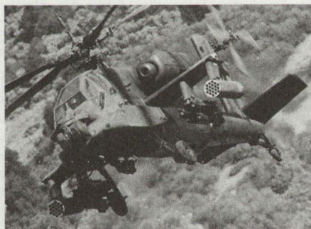
Für den neuen amerikanischen Kampfhelikopter AH-64 APACHE bestehen verschiedene Bewaffnungsmöglichkeiten.

Diese Staffel wurde nach Abschluss der NATO-Herbstmanöver der Heeresfliegerbrigade des VII. US Korps in Europa unterstellt. H.G.