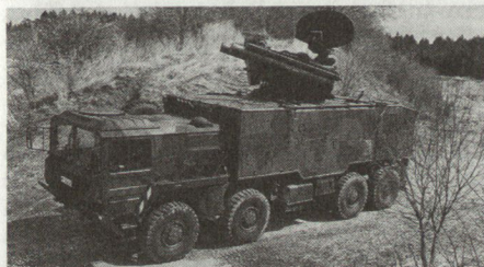
Neue Roland-Version auf Geländelastwagen. Dieses vollautonome Tiefflieger-Abwehrsystem hat eine maximale Reichweite von 8 Kilometern.

Seit Beginn dieses Jahres steht das neue Roland-System auch bei der US-Army in Evaluation. Zudem ist zu vermerken, dass die USA bereits heute innerhalb der «Rapid