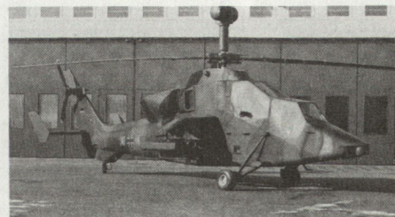
Modell des deutsch-französischen Kampfhelikopterprojektes PAH-2/HAC.

Deutschland beabsichtigt nun, infolge der verspäteten PAH-2-Zuführung ein Kampfwertsteigerungsprogramm für den heute im Einsatz stehenden PAH-1 vorzunehmen. Im Vordergrund steht dabei eine Wiederherstellung der Agilität, denn in den letzten Jahren ist durch Nachrüstung mit bestimmten, aus Flugsicherheitsgründen erforderlichen technischen Massnahmen das Abfluggewicht dieses Helikopters immer mehr belastet worden. Mit neuen Rô-