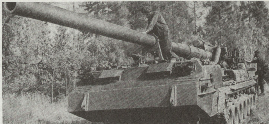
Selbstfahrkanone 2S7 (frühere NATO-Bezeichnung M-1975), aufgenommen in der Tschechoslowakei.

Die Einführung der beiden schweren Selbstfahrgeschütze verdeutlicht einmal mehr, die im WAPA laufenden Anstrengungen zur Verbesserung der Feuerunterstützung, die daneben auch mit einer Erhöhung der Gefechtsfeldmobilität verbunden ist. H.G.