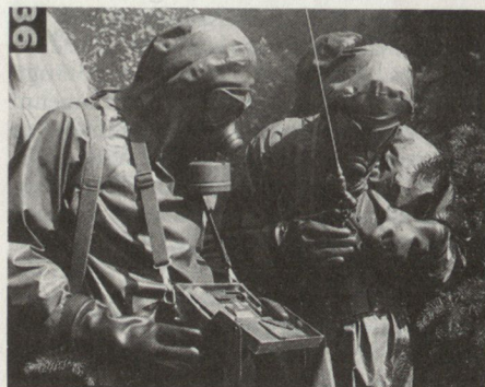
Das österreichische Bundesheer verfügt im Mobilmachungsfalle über total 1235 Spürtrupps.

Die ABC-Abwehrtruppe des österreichischen Bundesheeres ist eine unterstützende Waffengattung. Ihr Aufgabengebiet ist die Dekontamination und die grossräumige ABC-Erkundung sowie das Retten und Bergen und der Brandschutz vor allem in kontaminiertem Gelände.