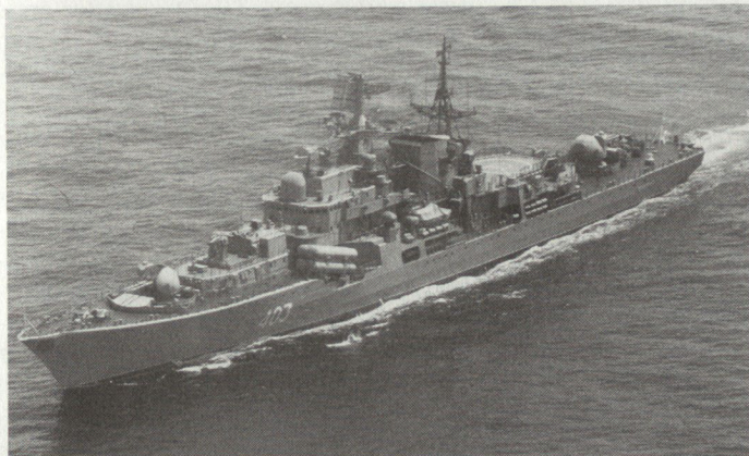
Die Rotbannerflotte schickt zunehmend auch moderne Einheiten, wie hier den Raketenzerstörer Otlichnyi der «Sovremennyi» -Klasse, zur 5. Eskadra ins Mittelmeer.

Diese Feststellung und jene der mangelnden logistischen Abstützung