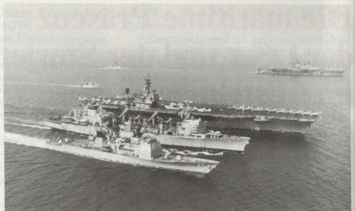
Kernstück der 6. US-Flotte sind die Trägerkampfgruppen, von denen eine bis zwei, in Krisenzeiten auch mehr, zum Verband gehören. Die Aufnahme zeigt den Flugzeugträger USS «John F. Kennedy», der zusammen mit dem hochmodernen Raketenkreuzer USS «Ticonderoga» (vorne) vom Versorgungsschiff USS «Detroit» im Mittelmeer Treibstoff, Munition und Lebensmittel übernimmt. Im Hintergrund der Flugzeugträger USS «Independence».

dungswege sicherzustellen hatte, neu definiert.