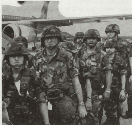
Landung amerikanischer Truppen in Deutschland anlässlich der strategischen Verlegeübung REFORGER 87.

REFORGER (REturn of FORces to GERmany) ist eine in der Regel jährlich stattfindende strategische Verlegeübung unter Beteiligung von Teilen des amerikanischen Heeres, der Marine und der Luftwaffe mit dem gemeinsamen Auftrag, Truppen von den USA nach Europa und zurück zu transportieren. Diese Verlegeübungen dienen zugleich der Glaubwürdigkeit der NATO-Abschreckung.