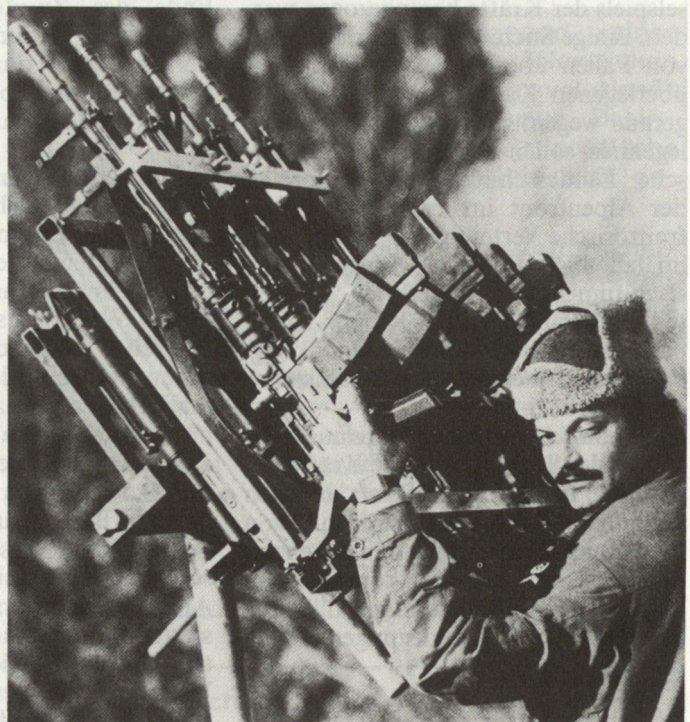
Flab-Selbstschutz – Improvisationen heute (Flab-«Vierling» im Einsatz bei Geb Gren Kp 36, 1986)