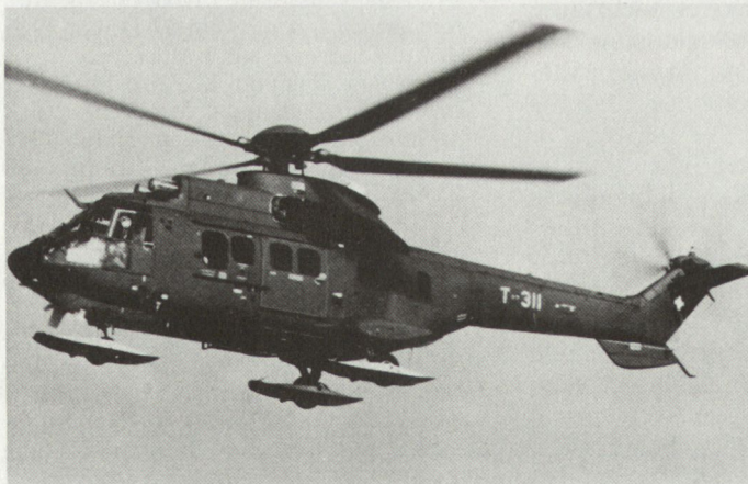
Feuerwehr im Gebirge – am raschesten mit Luftransport (Super-Puma)