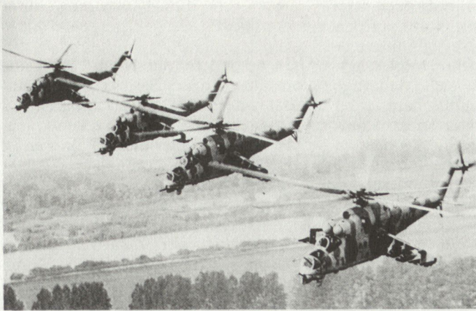
Grosse Feuerkraft, geringe Verletzlichkeit (Kampfhelikopter Mi-24)