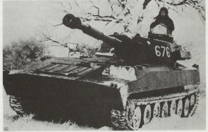
Die Haupt-Feuerunterstützungswaffe in der Mot S Div (78 Pz Hb 122 mm)