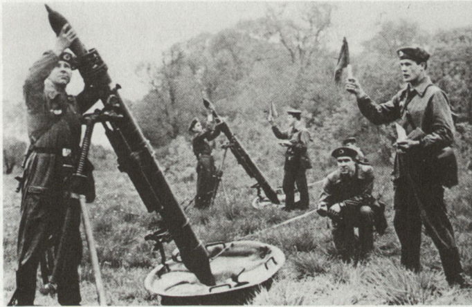
Dreimal mehr schwere Minenwerfer (24 Minenwerfer 120 mm M-43 im Mot S Rgt)