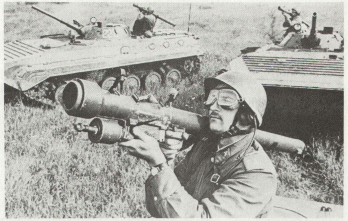
30 Flab-Selbstschutzwaffen im Mot S Rgt (Sa-7 in Feuerstellung)