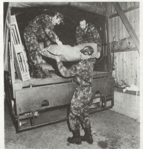
Futtermitteltransport für einen Bergbauern am Glaspas

Die geografischen und topografischen Verhältnisse des Berggebietes, verbunden mit der geringen Bevölkerungsdichte, haben mit der zunehmenden Motorisierung dazu geführt, dass die Versorgung der Zivilbevölkerung in den Bergdörfern mit Lebensmitteln und Gebrauchsgütern heute weitgehend auf dem Transportweg sichergestellt wird. Die örtlichen Versorgungseinrichtungen sind in den meisten Dörfern verschwunden. Damit sind die Schwierigkeiten für die Versorgung dieser Gebiete in Kri-