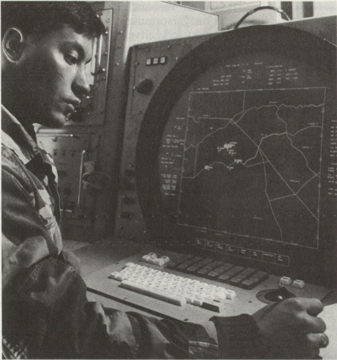
Bild 3. Datenempfangs- und -übertragungsgerät eines Artillerie-Schiesskommandanten.