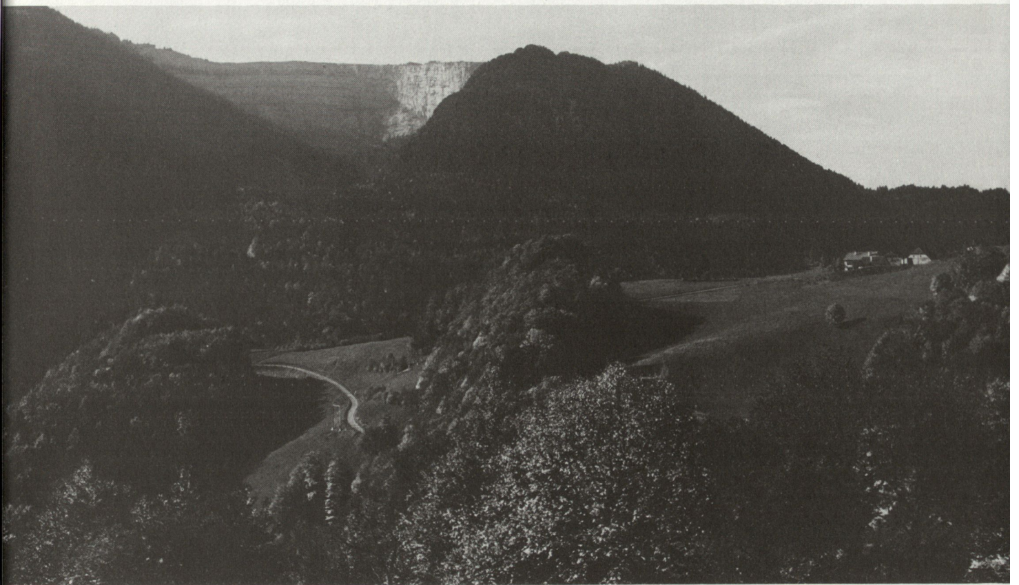
Neuenburger Jura (Creux du Van)

ner abgenützt haben, bevor er sich überhaupt festsetzen kann.