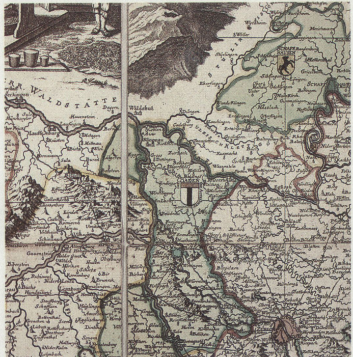
Abb. 1: Aus der Schweizerkarte Johann Jakob Scheuchzers (1712).

Weit davon entfernt, durch eine Verbesserung des Zugangs zu geographischer Information kriegstreibend zu wirken, hat hier also die Militärkarte einen rationalen Entscheid gegen den Krieg ausgelöst. Immerhin, eine allzu genaue Kenntnis des eigenen Landes bei Fremden galt den Völkern zu allen Zeiten als unerwünscht, der Schutz auch geographischer Information als patriotische Pflicht. Umgekehrt wollte man selber natürlich über möglichst genaue Kenntnisse verfügen, über umso genauere, je weiter sich die militärische Technik entwickelte. Davon ausgehend müsste man annehmen, alle Karten wären geheimgehalten worden. Dass dies nicht durchwegs der Fall war, ist einerseits dem Ehrgeiz der Kartographen, andererseits dem Erfordernis des Broterwerbs zuzuschreiben. Es wurde also publiziert, so etwa 1712 die Schweizerkarte des Zürcher Professors Johann Jakob Scheuchzer (Abb. 1), über welche unser Historisch-Biographisches Lexikon sagt: «Ihre Bedeutung liegt neben der Zusammenfassung des bisher Erreichten im Hinweis auf die Not-