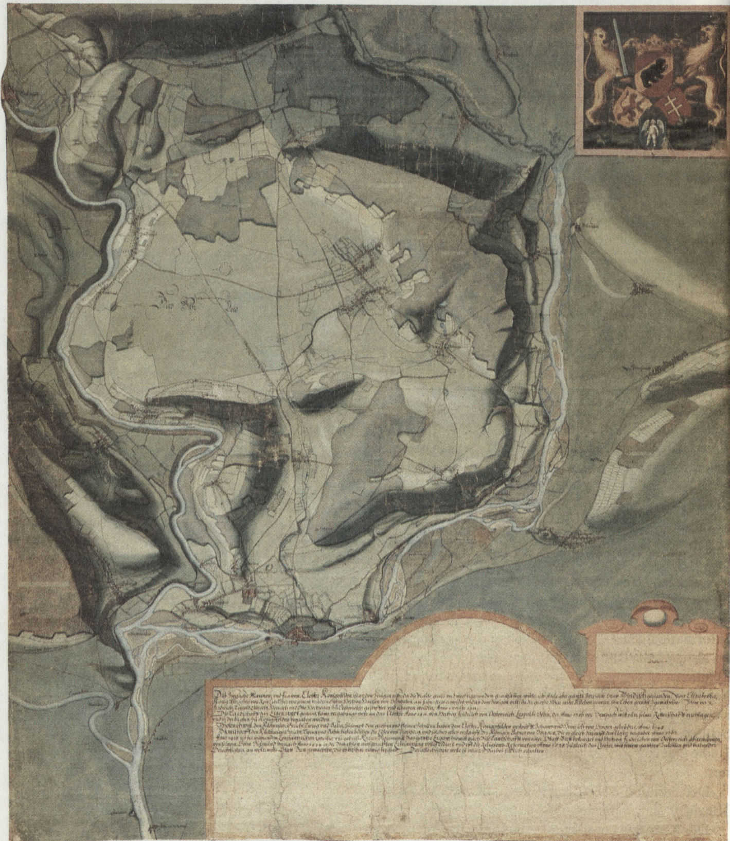
Abb. 2: Hans Conrad Gygers Karte des Wasserschlosses, vom Hofmeister von Königsfelden 1660 dem bernischen Kriegsrat übergeben.

wendigkeit weiterer Forschung und Arbeit.» (HBLs, s.v. Kartographie der Schweiz). Wer Scheuchzers Karte mit dem Werk Hans Conrad Gygers (Abb.2) vergleicht, erkennt die Spannweite zwischen der vergleichsweise harmlos-naiven zivilen Darstellung des Gebietes und der in allen Teilen zuverlässigen detaillierten Militärkarte.