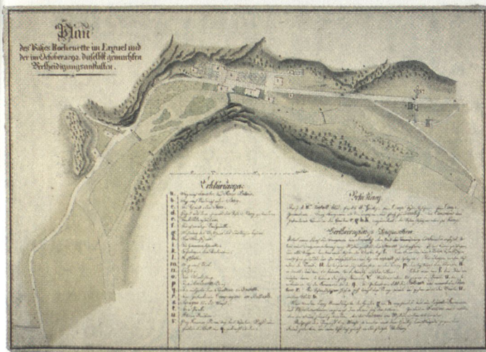
Abb. 9: Verteidigungsplan für das Reuchenette-Engnis.