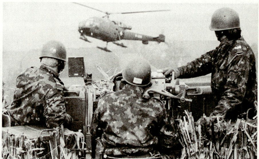
Bewachung und Überwachung

Diese Akzentsetzungen für künftiges Tun stellen weder die gültige Konzeption noch bisheriges Handeln in Frage. Ganz im Gegenteil: die Übungsfeststellungen bestätigen meine aufrichtige Überzeugung, dass unsere Armee dank ihrem Kampfverfahren, ihrer Ausrüstung und Ausbildung in hohem Masse vorbereitet ist, in einem (hoffentlich nie eintretenden) Ernstfall ihren Auftrag erfüllen zu können. ■