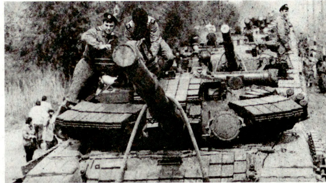
Abzug sowjetischer Panzer aus Ungarn. Zu beachten ist die angebrachte Reaktivpanzerung z. T. auch seitlich über den Schürzen

Wie die in der Militärpresse erschienenen Bilder der ersten Abzugsphase zeigen, werden aus der DDR primär Kampfpanzer des Typs T-64A abgezogen. Diese Version wurde ab Mitte der siebziger Jahre den sowjetischen Truppen zugeführt. Sie werden dort seit einiger Zeit durch die neuen Typen T-64B und T-80 ersetzt.