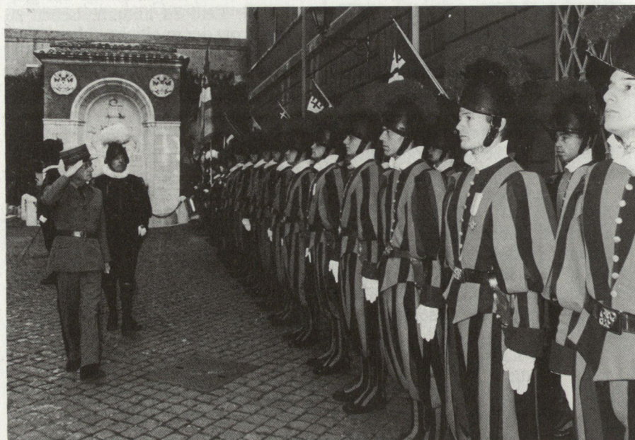
Oberst Buchs begleitet Korpskommandant Eugen Lüthy beim Abschreiten des Ehrenpiketts.