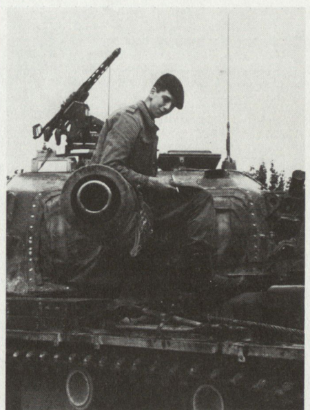
Ohne Papier geht auch beim Centurion nichts...

Anlässlich von Zugs- und Kompanieaussprachen konnte immer wieder festgestellt werden, dass sich die Soldaten auf jeder Stufe recht wohl fühlten und mit überdurchschnittlicher