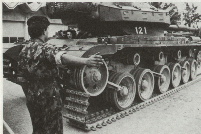
Fingerspitzengefühl ist gefragt: Raupenarbeit!