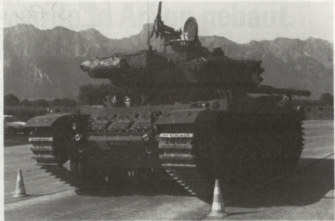
Fahrschule auf dem Panzer ergänzt die Simulatoren Ausbildung.