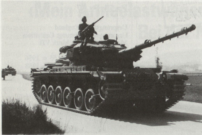
Als stolzer Panzerkommandant auf dem Rückmarsch vom Zielhang.