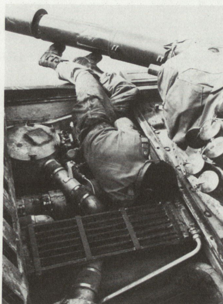
«Soldat und Technik» oder: der Schraubenschlüssel im Motorenraum.

Zu Beginn der RS bedeutete es für die meisten Rekruten eine Enttäu-