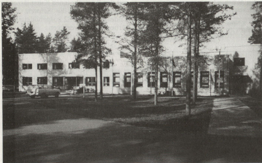
Das Ausbildungszentrum ist dem Satakunta Art Rgt angegliedert und verfügt über modernste Einrichtungen.

Auftrag der 4 Nordischen Staaten Schweden, Dänemark, Norwegen und Finnland durchgeführt (Schweden bildet die Staboffiziere, Dänemark die Militärpolizei und Norwegen die Logistikkoffiziere aller 4 Nordischen Staaten aus).