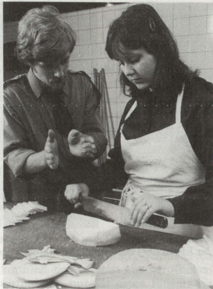
Fachausbildner gehören zum vertrauten Bild in Kursen und Schulen.

Während des Aktivdienstes wurden die meisten Einführungskurse sowie die Kurse für Gruppenleiterinnen im requirierten Hotel Axenfels in Morschach durchgeführt. Die Tessinerinnen erhielten ihre Grundausbildung im Castello Trevano bei Lugano und die Gattung 10 (Sanität) in der Kaserne von Basel. Ab 1949, als die Ausbildungstätigkeit wieder aufgenommen werden konnte, begann die «Ära Kreuzlingen». Die Kaserne ist idyllisch gelegen und sehr menschenfreundlich eingerichtet. Einzig was den Sport anbelangt, so bietet sie keine Schlechtwettermöglichkeit. Der anfangs siebziger Jahre gestellte Antrag für den Bau einer Mehrzweckhalle fand bei den zuständigen Instanzen keine Gnade. Neben Kreuzlingen wurden in all den Jahren aber auch eine ganze Reihe weiterer Kasernen