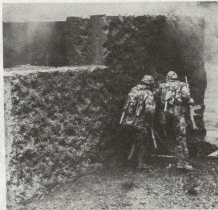
Bild 7. Bunkerartiges Häuserkampfbjekt in Walenstadt

■ Drittens: Die Ausbildungsanlagen müssen erweitert, ergänzt und zum Teil neu konzipiert werden. Beispielsweise müssen die bestehenden, jedoch vollständig zerschossenen Häuserkampfbjekte ersetzt und zu eigentlichen Ortskampfanlagen erweitert werden. Um zudem auf den Bau der bisher erstellten «Bunker» (Bild 7) zugunsten von landesüblichen Gebäuden verzichten zu können, soll das Verbandstraining des Ortskampfes wie erwähnt nicht mehr im scharfen Schuss, sondern mit Hilfe der Infanteriewaffen-Laser-Simulation und allenfalls unter Verwendung von Kurzbahn-Patronen und neuen Zieldarstellungsmöglichkeiten durchgeführt werden können.