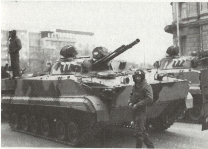
Hauptbewaffnung des neuen BMP: Kanone, vermutlich vom Kaliber 100 mm und parallel dazu eine 30-mm-Automatenkanone