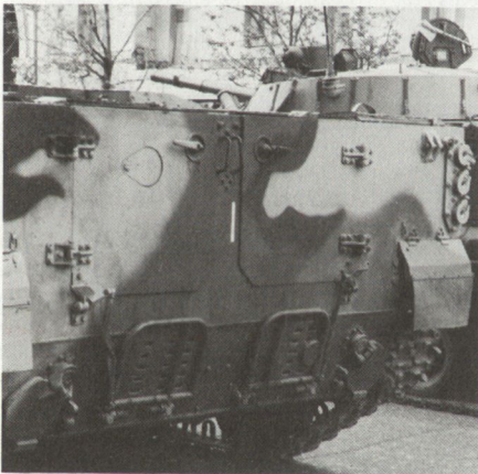
Heckansicht des schwimmfähigen BMP-3 mit den beiden Hecktüren und den Öffnungen für die Wasserstrahlantriebe

Waffensystem ist die Bewaffnung: Der neue Kampfschützenpanzer verfügt über eine Kanone, wahrscheinlich vom Kaliber 100 mm. Parallel dazu ist rechts eine 30-mm-Maschinenkanone installiert. Beide Waffen sind vermutlich starr miteinander verbunden. Schliesslich befindet sich links von der Hauptwaffe noch ein Mg 7,62 mm sowie in den Bug-ecken je ein Mg 5,45 mm.