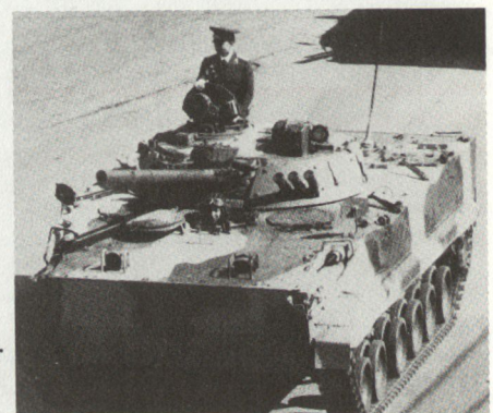
BMP-3 anlässlich der «Siegesparade» 1990 in Moskau

Besonders eindrucksvoll bei diesem erstmals erkannten