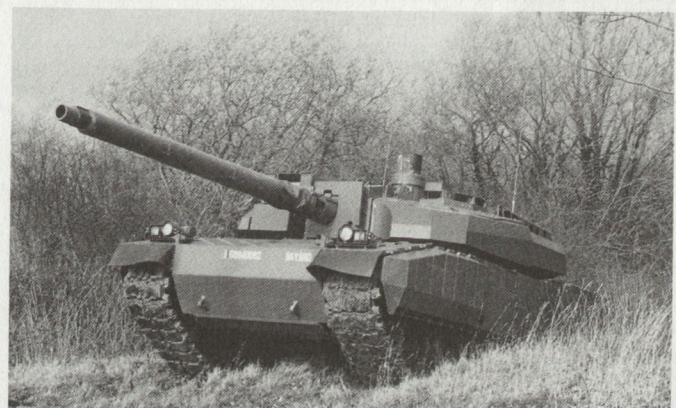
Französischer AMX Le Clerc; dieser neuste westliche Panzer soll 1991 in die Serienproduktion gehen.