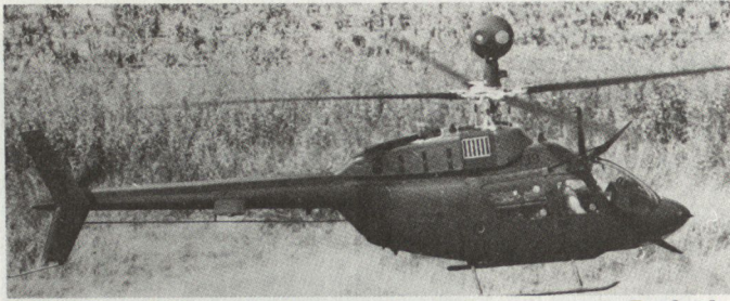
OH-52D Aufklärungshelikopter mit vier Rotoren und «Beobachungskugel».

ne Arbeit gut getarnt durch die Umgebung ausführen, ausserhalb der Reichweite konventionellen Radars.