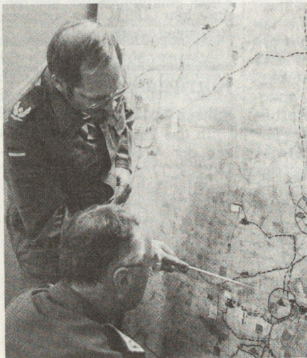
Von der Brigadeebene aufwärts sollen zukünftig die Stäbe mit Ausnahme der Kdt, Gst- und einiger Stabsof ausschliesslich aus Führungstruppen bestehen.

(Aus Europäische Wehrkunde/WWR Nr. 9/89)