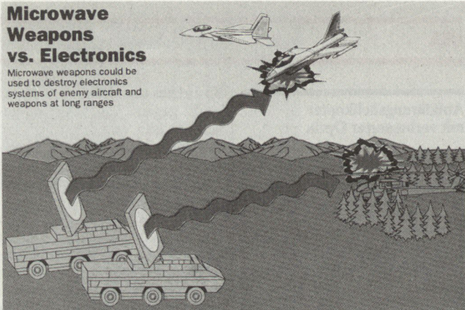
Schematische Darstellung der Funktionsweise von Mikrowellenwaffen

Microwave weapons could be used to destroy electronics systems of enemy aircraft and weapons at long ranges