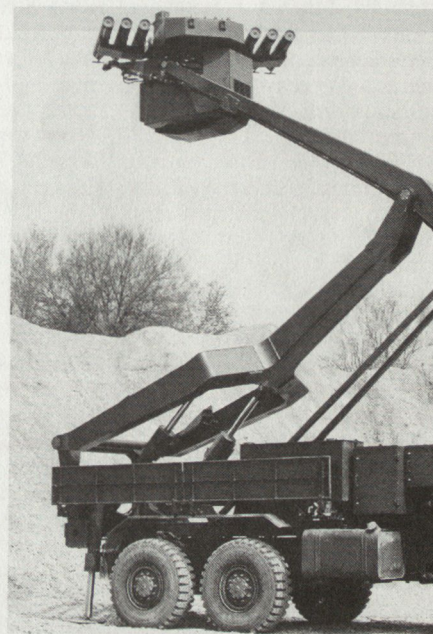
Als Träger der neuen PAL-Systeme «Hot 2» ist auch die Kampfplattform «Panther» vorgesehen.

Auch die amerikanische Konkurrenz schläft nicht. In den USA steht die «TOW 2A» mit Tandemgefechtsskopf bei den amerikanischen Streitkräften bereits in Einführung. Eine Lizenzfabrikation dieser von der Firma Hughes entwickelten PAL wird in Grossbritannien und der Schweiz durchgeführt. Die Engländer wollen zudem ihre «Swingfire-Systeme» noch bis Ende der neunziger Jahre im Einsatz behalten. Auch bei diesem System ist daher eine Kampfwertsteigerung vorgesehen, wobei vorderhand Versuche mit einem optischen Wärmebildvisier durchgeführt wer-