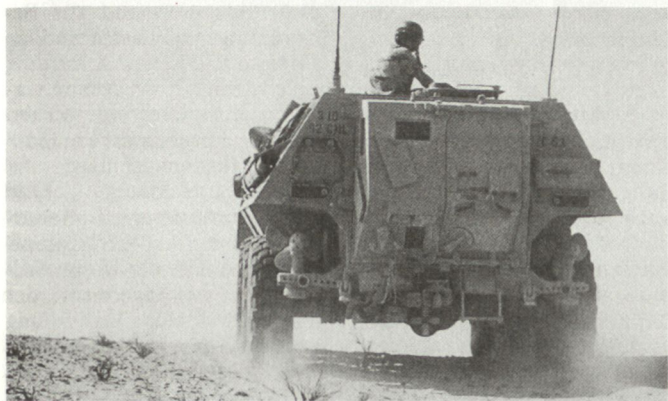
Von Deutschland gelieferte ABC-Spürpanzer Fuchs standen bei den Multinationalen Streitkräften am Golf im Einsatz.

hilfen gingen auch an Frankreich, die Türkei und Israel.