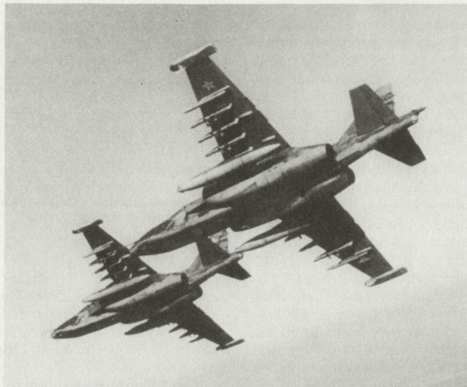
Erdkampfflugzeuge Su-25 Frogfood. Gut sichtbar sind die Unterflügelstationen für eine Waffenzuladung von max. 4400 kg.

Mit der Su-25 von Sukhoi hat die legendäre «Stormovik» des letzten Weltkrieges einen würdigen Nachfolger gefunden. Obwohl ursprünglich zur Unterstützung der sowje-