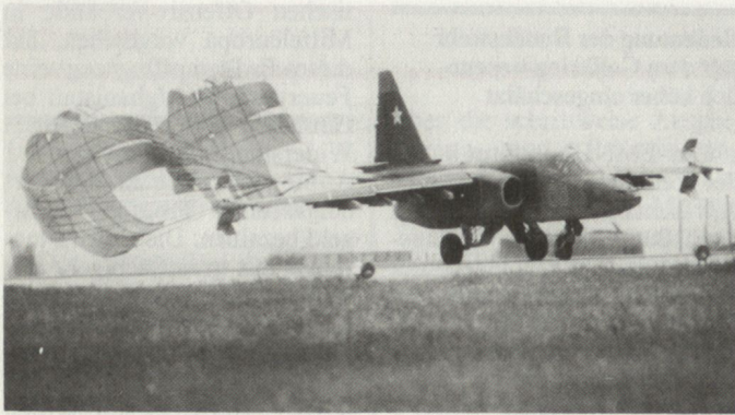
Su-25 mit Bremsfallschirm.

«schmutzigen Waffen» vorgehen. Gemeint sind darunter Napalm-, FAE- und Kanisterbomben, aber auch moderne lasergelenkte Gleit-, Streu- und Schüttbomben. Kernstück der Bewaffnung bildet eine 30-mm-Zwillingskanone von hoher Schussfolge, die panzerbrechende Urankernmunition verschiesst.