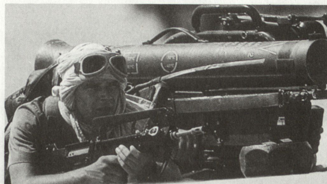
Französischer Soldat im Golfkrieg, ausgerüstet mit PAL-System Milan.

Gemäss Aussagen von Verteidigungsminister Pierre Joxe sind gegenwärtig folgende Pla-