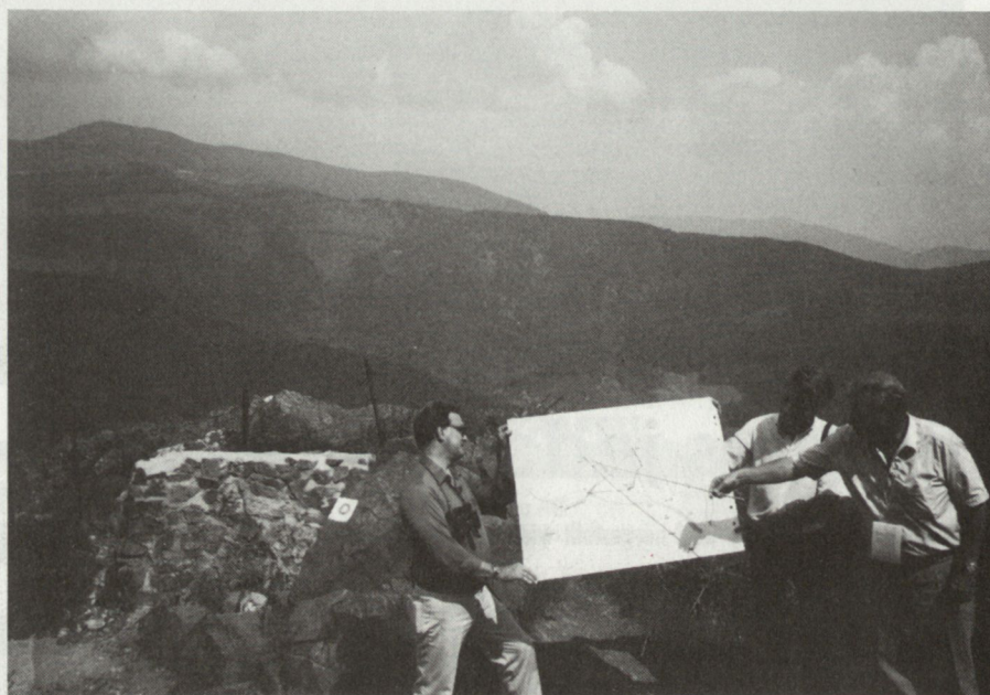
Erkundung als aufrüttelndes Erlebnis: Hartmannsweilerkopf

ASMZ: Wem steht die Mitgliedschaft zur GMS offen und wer beteiligt sich vor allem an diesen Reisen?