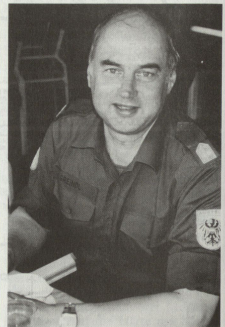
Der Oberkommandierende Generalmajor Greindl aus Österreich verfügt über jahrelange Erfahrung bei friedenserhaltenden Operationen der Vereinten Nationen.

Unter der Oberaufsicht des UNO-Generalsekretärs und des Sicherheitsrates wurde Generalmajor Günther G. Greindl zum Oberkommandierenden der militärischen Beobachtermission ernannt. Er ist 51 Jahre alt, 1977/