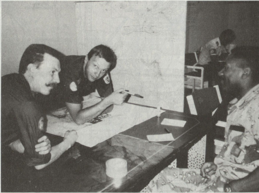
In der Operationssektion im Hauptquartier der UNIKOM werden die vom Irak gelieferten Vermineungskarten analysiert.

leben in Zelten, die schweren Tätigkeiten werden am frühen Morgen und am Abend erledigt, während des Tages ist die Hitze zu gross. Die zirka 300 Mann starke kanadische Genieeinheit hat die Minenräumung vorangetrieben, bis jetzt ohne jeglichen Unfall. Die Minen sind für uns nach wie vor ein grosses Problem. Wegen der Auswirkungen der Hitze und der Gefahr des unkonzentrierten Arbeitens der Soldaten ist die Minenräumung für zwei Monate eingestellt worden.» Zuversichtlich stellt der Kommandant der UNIKOM jedoch fest: «Die Beobachter haben sich mit den harten Wüstenbedingungen sehr gut abgefunden. Wir haben keine ernsthaften gesundheitlichen Probleme, und die Moral bei den UNO-Soldaten ist hoch , weil wir bis jetzt auf eine erfolgreiche Mission zurückblicken können.» Ein Flug entlang der gesamten Grenze und eine Fahrt während eines Sandsturms durch das Wadi al Batin bestätigen, welche harte Wüstenbedingungen die UNIKOM-Soldaten an der Westgrenze Kuwaits zu Irak zu meistern haben.