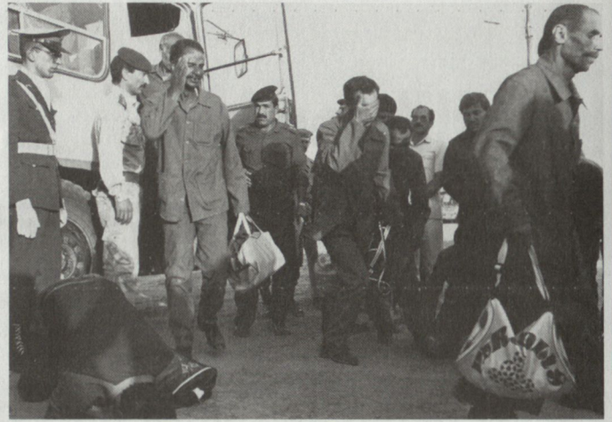
Iraker kehren aus kurzer Gefangenschaft zurück. Missionen der Hilfswerke in Gefängnissen finden meistens unter Ausschluss der Medien statt.