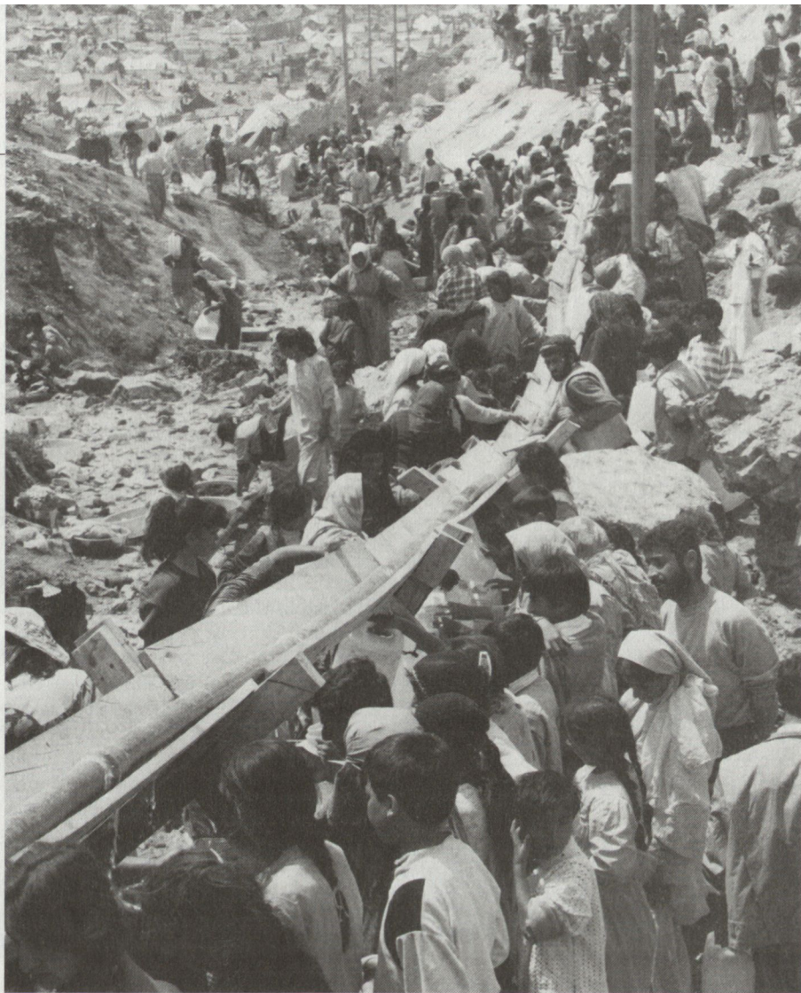
Wassernot können sich Westeuropäer nur schwer vorstellen. Deshalb schicken Rotkreuzvertreter solche Bilder – hier von kurdischen Flüchtlingen – nach Hause. (Bild D. Personnaz/Liga)

Über erlittene Kollateralschäden Iraks war das IKRK übrigens, wie in Bonn bestätigt wurde, laufend informiert. Die Meldungen betrafen die Energie – wo die Schäden eine «humanitäre Katastrophe» auslösten – und die Wassernot im Süden, die zu Epidemien führte, was das Einfliegen von Infusionsmitteln nötig machte. «Aber unsere Communiqués darüber haben kaum etwas bewegt», klagte der Sprecher des IKRK.