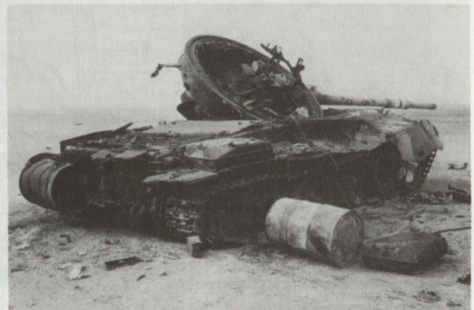
Bei IRISHAN finden wir in der Wüste in den zerschlagenen Bereitstellungsräumen irakischer Panzerverbände Hunderte von Panzern, Kampfschützenpanzern, Artillerie- und Flabgeschützen. Die Wirkung moderner panzerbrechender Munition ist von kaum beschreiblicher Wucht.