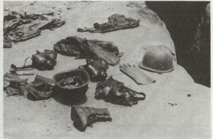
In der südlichen «Saddam-Husseini-Verteidigungslinie» liegen in grossen Mengen Ausrüstungsgegenstände, Waffen und Munition herum.