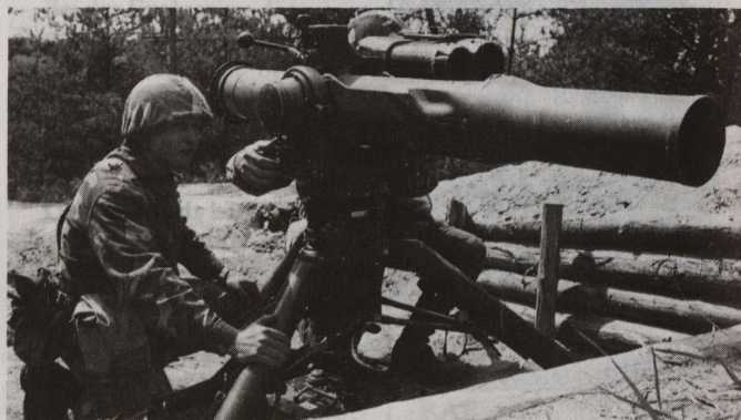
Die finnischen Streitkräfte sind mit östlichem und westlichem Material ausgerüstet (oben sowjetische PAL AT-4, unten amerikanische TOW)

angebotenen Waffen und Geräte bereits in der finnischen Armee im Einsatz stehen, so ist dies heute für Finnland eine vorteilhafte Gelegenheit, sich je nach Bedarf günstig mit Ersatzteilen und Reservesystemen einzudecken.