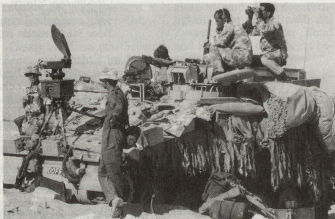
Der heutige Bestand des britischen Heeres (im Bild Angehörige einer Art Aufkl Einheit) soll um 25 Prozent gekürzt werden.

Gemäss bisher vorliegenden Schätzungen soll der Truppen-