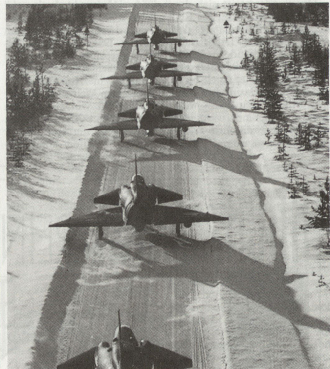
Eine Projektgruppe ist daran, die schwedische Luftraumverteidigung zu überprüfen.

Das Forschungsprojekt Luftverteidigung soll bis Mitte 1993 abgeschlossen sein. Damit beschäftigt sind ungefähr 100 Personen aus verschiedenen Bereichen des Verteidigungsministeriums und der staatlichen Rüstungsindustrien. hg