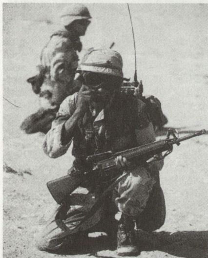
Für die Angehörigen der 101. Luftlandedivision waren GPS-Empfänger im Golfkrieg ein unentbehrliches Mittel.