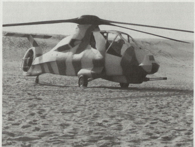
Maquette des neuen Kampfhelikopters RAH-66 Comanche.