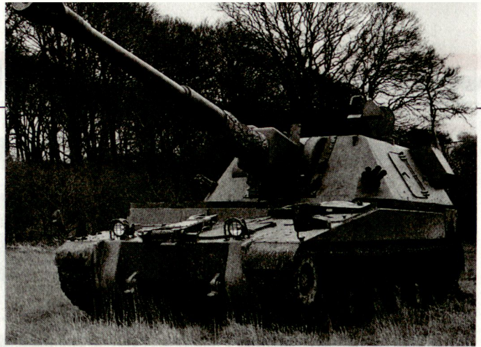
Prototyp der neuen britischen Panzerhaubitze 155 mm AS90, deren Auslieferung an die Royal Artillery kürzlich begonnen hat.

Diese B27-Studie kam zum Schluss, dass eine optimale Auflockerung sowie ausreichende Tarnung und Mobilität notwendige Voraussetzungen zur Gewährleistung der eigenen Konterbatteriefähigkeit bilden. Diese Erkenntnisse waren die Grundlage für das