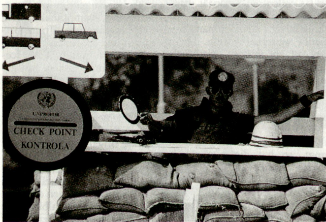
Belgischer UNO-Soldat in Kroatien. Trotz Reduktion der Streitkräfte soll das belgische Engagement für friedenserhaltende Missionen weiter verstärkt werden.

Das von der belgischen Regierung beschlossene Reformvorhaben ist im Lande – insbesondere bei den Militärs – nicht ohne Kritik geblieben. Verschiedene Kreise, insbesondere Generalstabschef Charlier, stemmten sich vehement gegen die Abschaffung der Wehrpflicht und die einschneidenden Truppenreduzierungen. Man hatte sich bis zuletzt für einen Streitkräfteumfang von mindestens 60 000 Mann eingesetzt.