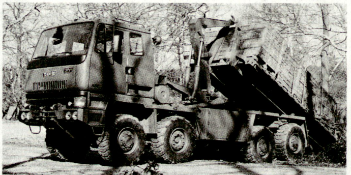
Wichtig ist die zeitgerechte Bereitstellung der Munition in der Nähe der vorgesehenen Stellungsräume. Angewandt wird das Munitionsversorgungssystem DROPS.

Das dritte wesentliche Element ist das Munitionsversorgungssystem DROPS (Demountable Rack Offloading and Pick-up System). DROPS ermöglicht die vorsorgliche und rechtzeitige Verteilung und Bereitstellung der Munition im ganzen Stellungsraum der Artillerie. Gegenwärtig läuft die Beschaffung einer grossen Zahl von Munitionstransportern (Geländelastwagen Leyland). Die Munition wird auf so ge-