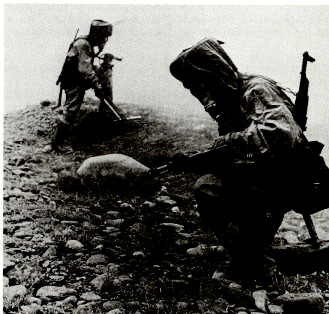
Ein weltweites Verbot chemischer Waffen dürfte aus heutiger Sicht kaum durchsetzbar sein.

gesetz auch ein wichtiger Schritt zur Verstärkung der Auslastung in den eigenen Rüstungsfirmen. Die neue, seit Herbst 1991 im Amt stehende bürgerliche Regierung will eine Stärkung der umfangreichen schwedischen Rüstungsindustrie herbeiführen. Aus diesem Grunde wird schon heute eine Annäherung an die IEPG (Independent European Programme Group) angestrebt. Die IEPG besteht aus 13 europäischen NATO-Staaten und hat zum Ziel, gemeinsam eine leistungsfähige Rüstungsindustrie in Europa zu erhalten. Die schwedische Wehrindustrie befindet sich in einem Restrukturierungsprozess. Bereits vor einiger Zeit sind die beiden grössten Rüstungsfirmen Bofors und FFV Ordnance zur Swedish Ordnance verschmolzen worden. Andere kleinere Firmen suchen den Zusammenschluss mit ausländischen Rüstungskonzernen. Schon jetzt steht fest, dass sich das neue Verteidigungsgesetz als wichtiger Schritt zur Stärkung der in einer Krise steckenden Rüstungsindustrie erweisen wird. hg