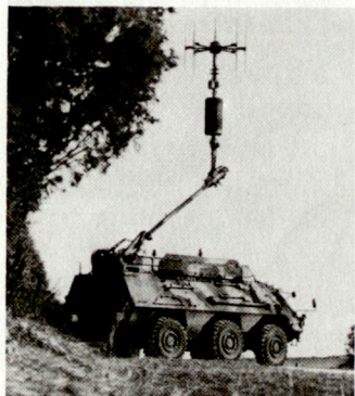
Ab 1995 sollen die ersten ELOKA-Trupps (EKF) im Heer einsatzbereit sein, darunter auch das neue mobile Peilsystem auf Schützenpanzer.

Für Ausbildung und Vorbereitung auf konkrete Einsätze, zu denen Offiziere entsandt werden sollen, steht in Wien das «Kommando Auslandseinsätze» zur Verfügung. In einer mehrwöchigen bzw. mehrtägi-