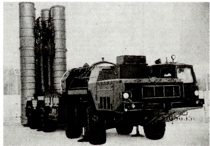
Abschussfahrzeuge des Raketenabwehrsystems S-300 (NATO-Codename: SA-10 Grumble).

Rüstungsindustrie zu exportieren. In den letzten Monaten wurde das sowjetische Konkurrenzprodukt zu Patriot verschiedenen Staaten, u. a. auch an Israel, zum Verkauf angeboten. Die scheinbar vorhandenen technischen Vorteile des Raketenabwehrsystems S-300 werden heute aber vor allem durch die Tatsache kompensiert, dass sich die Patriot-Abwehrwaffen im Golfkrieg unter kriegsmässigen Bedingungen bereits bewährt haben. Die Sowjetunion ihrerseits dürfte es nach der irakischen Niederlage im Golfkrieg mit diesem System schwierig haben, sich auf dem internationalen Waffen-