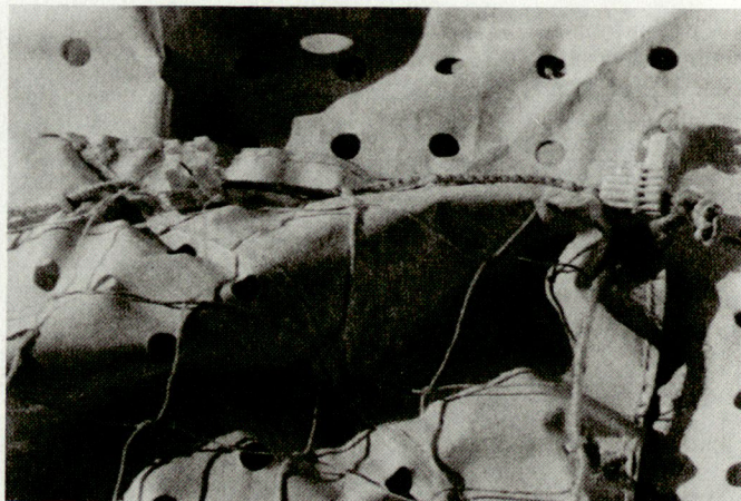
Beispiel eines italienischen Tarnnetzes für schneebedeckte Umgebung: Es reflektiert genauso wie der Schnee.

KSZE-Inspektion nach genau festgelegten Regeln. Den Ungarn standen deshalb nach ihrer Ankunft in Belgien 16 Stunden zur Verfügung, um die Einrichtung zu bezeichnen, die sie als erste besichtigen wollten. Ihre Wahl fiel auf den Stützpunkt Beauvechain. Nach der Bezeichnung des Ortes wird dem inspizierten Land eine Frist von 6 Stunden eingeräumt, um die Inspizierten an Ort und Stelle zu geleiten. Dabei ging es in Beauvechain vor allem um die Kampfflugzeuge F-16. Die noch in die Versuchs-