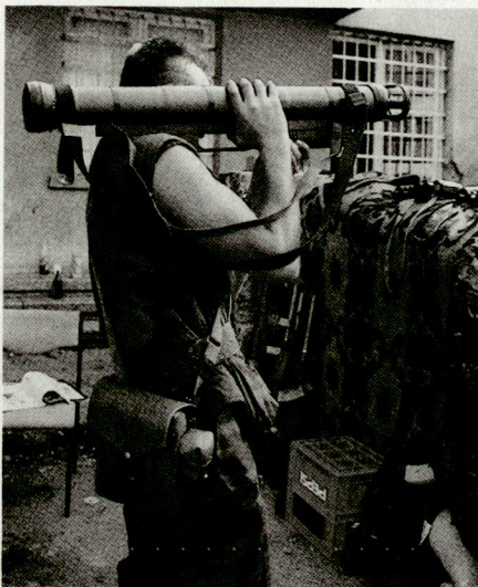
Angehöriger der kroatischen Miliz, ausgerüstet mit Raketenrohr-Armbrust.

Die kuwaitischen Verluste setzen sich aus den Opfern der irakischen Angriffshandlungen im Herbst 1990 und weiteren Opfern infolge der Übergriffe der irakischen Besatzungstruppen zusammen. Tausende von Kuwaitis wurden dabei nach Irak verschleppt. Die genaue Zahl der kuwaitischen Zivilopfer ist immer noch nicht bekannt, Schätzungen schwanken zwischen 5000 und 10000 Toten.