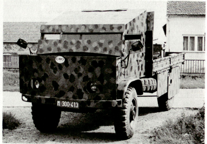
Leicht gepanzerter Geländelastwagen Unimog (1,5t) aus eigener kroatischer Produktion. Auf der Ladebrücke ist in der Regel eine Kanone 20 mm montiert.

Innert weniger Monate ist Jugoslawien zu einem riesigen Waffenumschlagplatz geworden, der nicht nur die überzähligen Bestände des WAPA aufnimmt, sondern auch die Produktion westlicher Firmen und von solchen aus Dritt-Welt-Ländern (Stgw SAR-80) aus Singapur, Präzisionskarabiner Steyr Police, israelische Maschinenpistolen Uzi, deutsche Heckler & Koch MP-5, italienische Franchi-Gewehre (SPAS-12). Finanziert werden die Ankäufe durch die Regierung von Ljubljana und Zagreb, aber auch von Kroaten und Slowenen im Ausland. Die Zufuhr geschieht über österreichisches Territorium. So wurden den slowenischen Reservisten etwa rumänische und ungarische Kalaschnikows ausgeteilt, Steyr-Präzisionsgewehre, Raketenrohre-Armbrust und sogar SA-7-Boden-Luft-Raketen aus ungarischer, eventuell nordkoreanischer Produktion! Insgesamt handelt es sich um leichtes Material, das gut für den Guerillakrieg geeignet ist. Die Raketenrohre