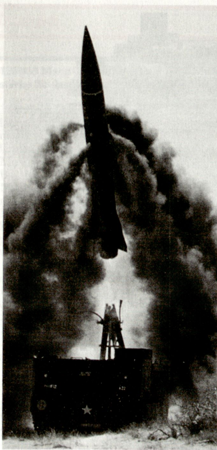
Die taktischen Atomwaffen, u.a. auch die in Europa stationierten Lance-Systeme (Bild), sollen ausser Dienst gestellt werden.