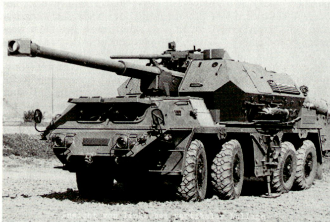
Produkt der tschechoslowakischen Rüstungsindustrie – Selbstfahrkanoone 152 mm M77 DANA auf TATRA-Fahrgestell.

sion» gibt es nicht. Trotzdem wird dieser Begriff insbesondere im Zusammenhang mit der Abrüstung, d.h. der Reduktion von Waffen- und Gerätesystemen, ins Feld geführt.