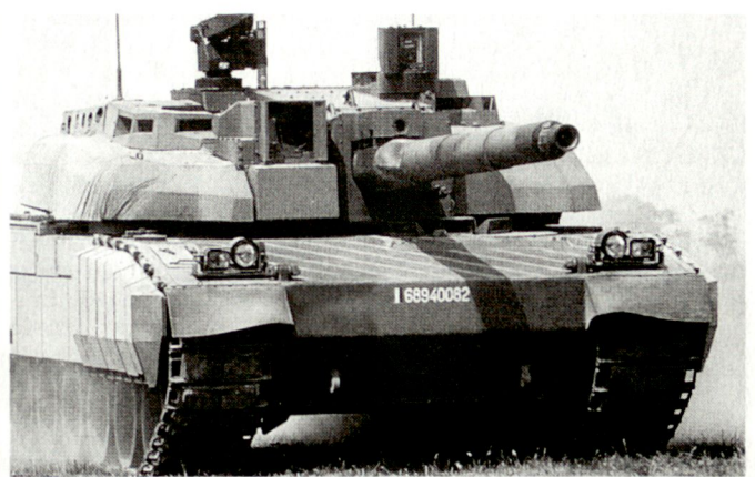
Bei den laufenden Rüstungsbeschaffungen für das französische Heer hat der Kampfpanzer Leclerc erste Priorität.

Verzichtet wird auch auf die neue strategische Atomrakete S-45, die als Ersatz für die auf dem Plateau d'Albion silogestützten, veralteten S-3 gedacht war. Davon betroffen ist insbesondere die Firma Aérospatiale. Ursprünglich war die Beschaffung von 30 solcher Systeme im Wert von 30 Mrd. fFr. geplant gewesen. Anstelle der nun annullierten Boden-Boden-Systeme will man die Ent-